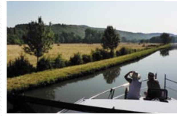
Canal du Nivernais – inte en fläkt på den stilla kanalen.

Ur "Från sluss till sluss på franska kanaler".