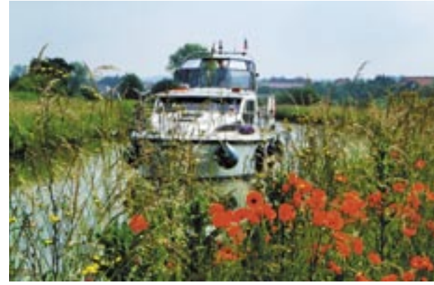
Från motorbåten "Vanadis" har paret Grünbaum njutit av Frankrike, här på Canal des Houillères.