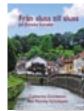
"Från sluss till sluss på franska kanaler" (Prisma) av Catharina och Tommy Grünbaum.

Vi har också kommit till riktiga städer, och det utan att behöva missa avfarter på hetsiga motorleder, utan att behöva ta oss in genom trista förorter och utan att behöva leta efter hotellrum. Reims, Metz, Nancy, Verdun, Dijon, Strasbourg, ja till och med Paris