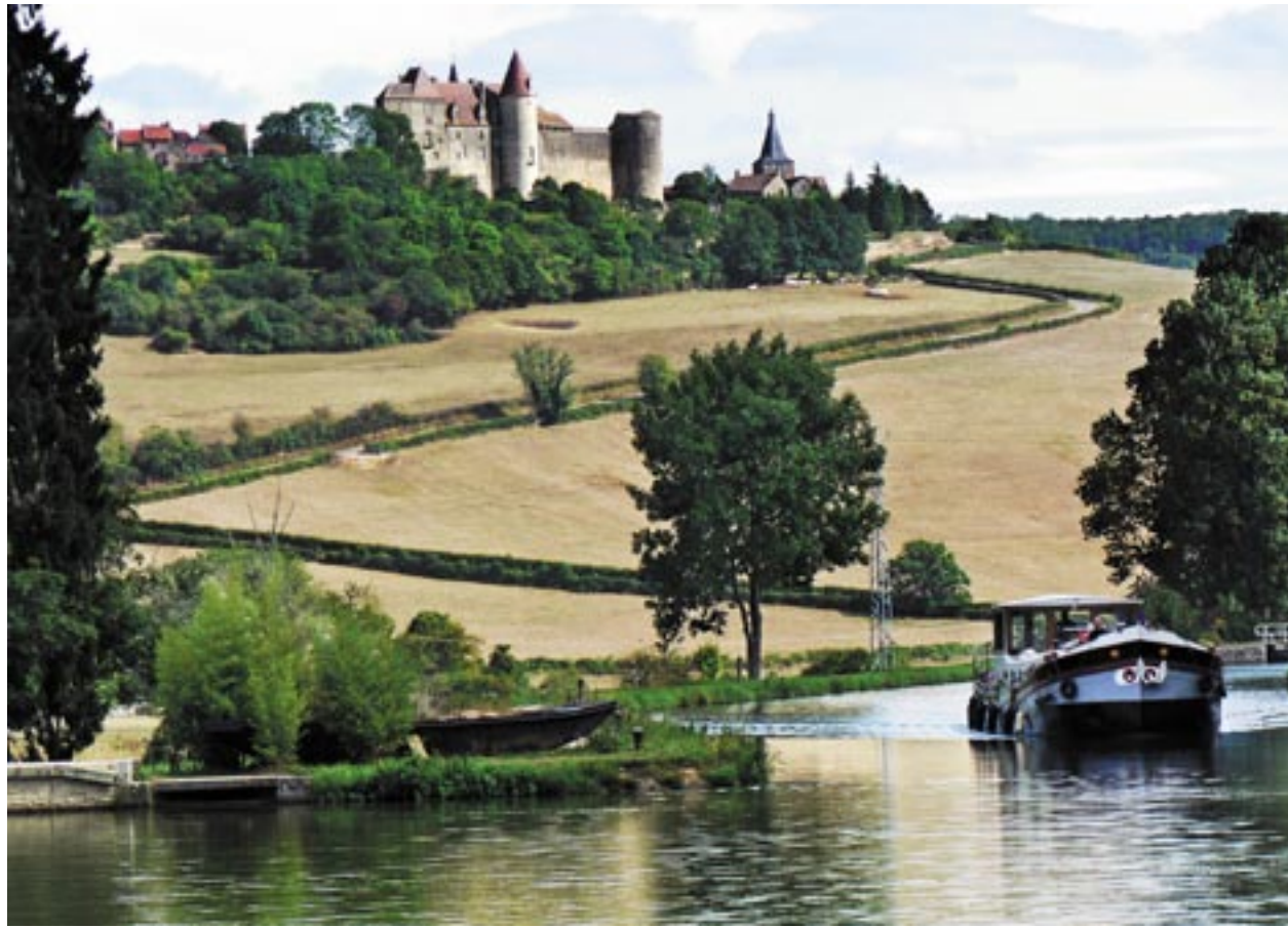
Châteauneuf i Bourgogne, som en medeltida målning. Under en semester på de franska kanalerna är man hela tiden utsatt för intryck – och man har tid att ta dem till sig!