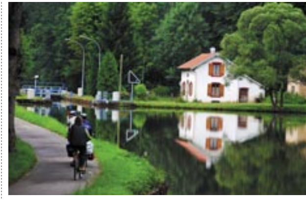
Canal des Vosges – dragvägen mellan slussarna är cyklistens fröjd.